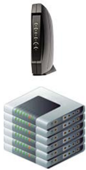
アナログモデムBOX または集合モデム