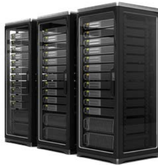
汎用サーバ上で稼動する ソフトウェアモデム アプリケーション